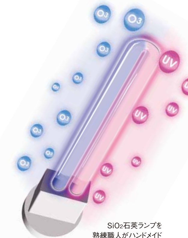
SiO 2 石英ランプを 熟練職人がハンドメイド