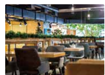
[ レストラン・カフェ ]