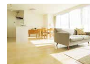
[ リビング ]