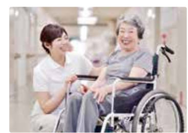
[ 老健施設 ]