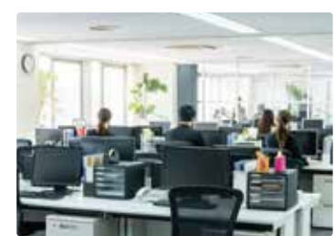
[ オフィス ]