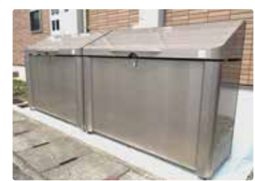
[ ダストスペース ]