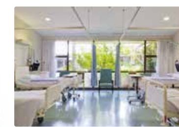
[ 病室 ]