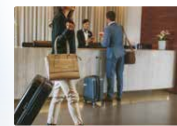
[ ロビー ]