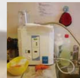
老健施設での使用例

手洗いや洗面にも 高い安全性を誇り、人体にも影響ありません。 環境に配慮したオゾンで、 安心してご利用いただけます。