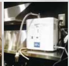
レストランでの使用例