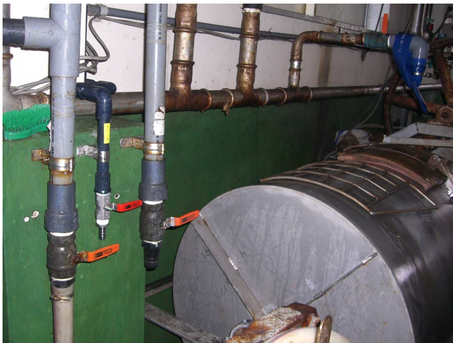
写真 C ステンボールバルブ、H I V P配管